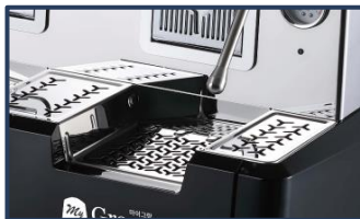
20온스 컵 트레이