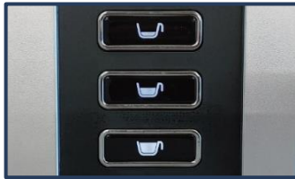
원터치 3종 추출