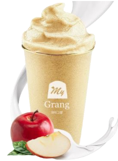
APPLE YOGURT SMOOTHIE