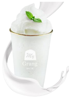
PLAIN YOGURT SMOOTHIE