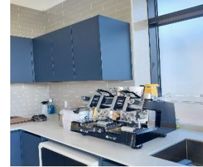
사무실 · 관공서