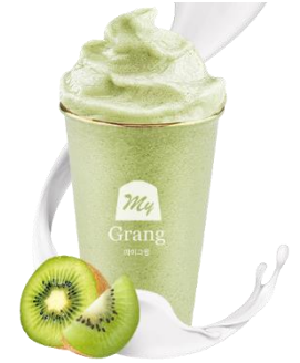
KIWI YOGURT SMOOTHIE