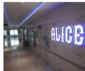
북카페 · 스터디카페