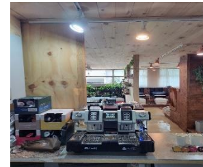
마사지 · 피부관리샵