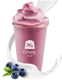
BLUEBERRY YOGURT SMOOTHIE