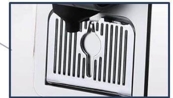
2단 샷잔 거치대