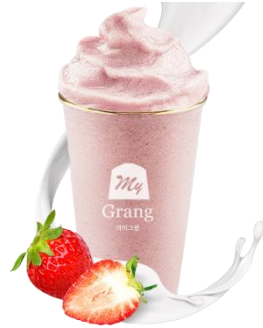
STRAWBERRY YOFURT SMOOTHIE