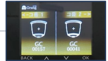
소형 LCD 모니터