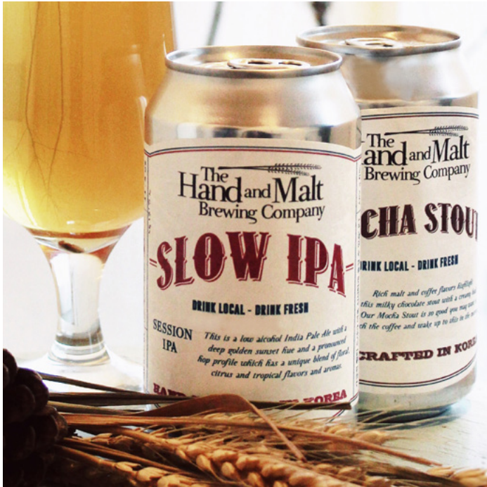
THE HAND & MALT SLOW IPA MOCHA STOUT