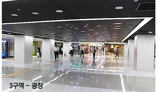
3구역 - 광장