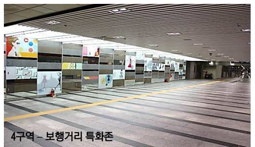
4구역 - 보행거리 특화존