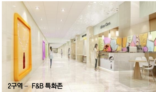
2구역 - F&B 특화존