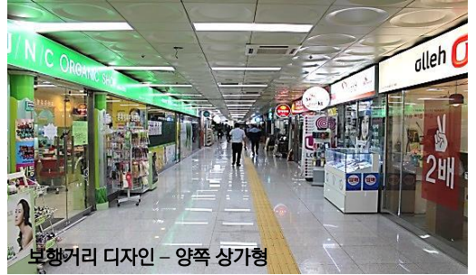
보행거리 디자인 - 양쪽 상가형