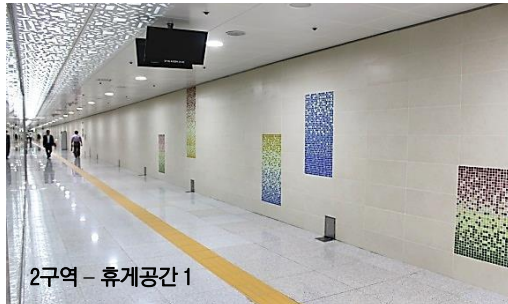
2구역 - 휴게공간 1