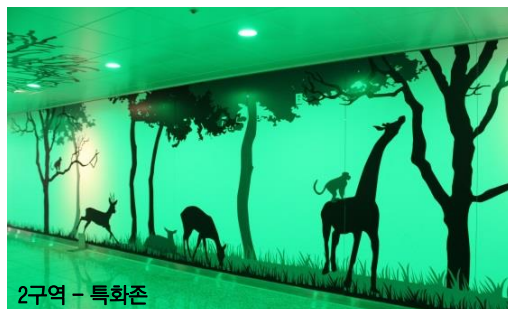
2구역 - 특화존