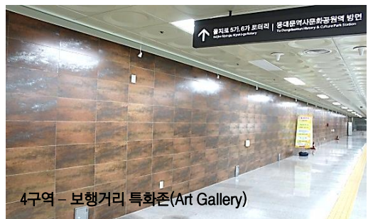
4구역 - 보행거리 특화존(Art Gallery)