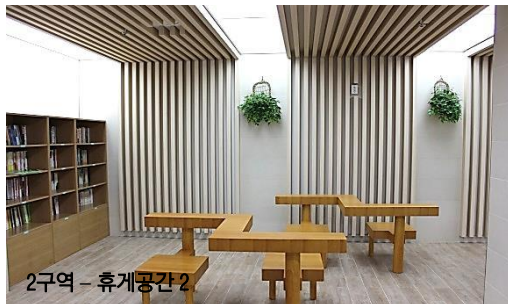
2구역 - 휴게공간 2