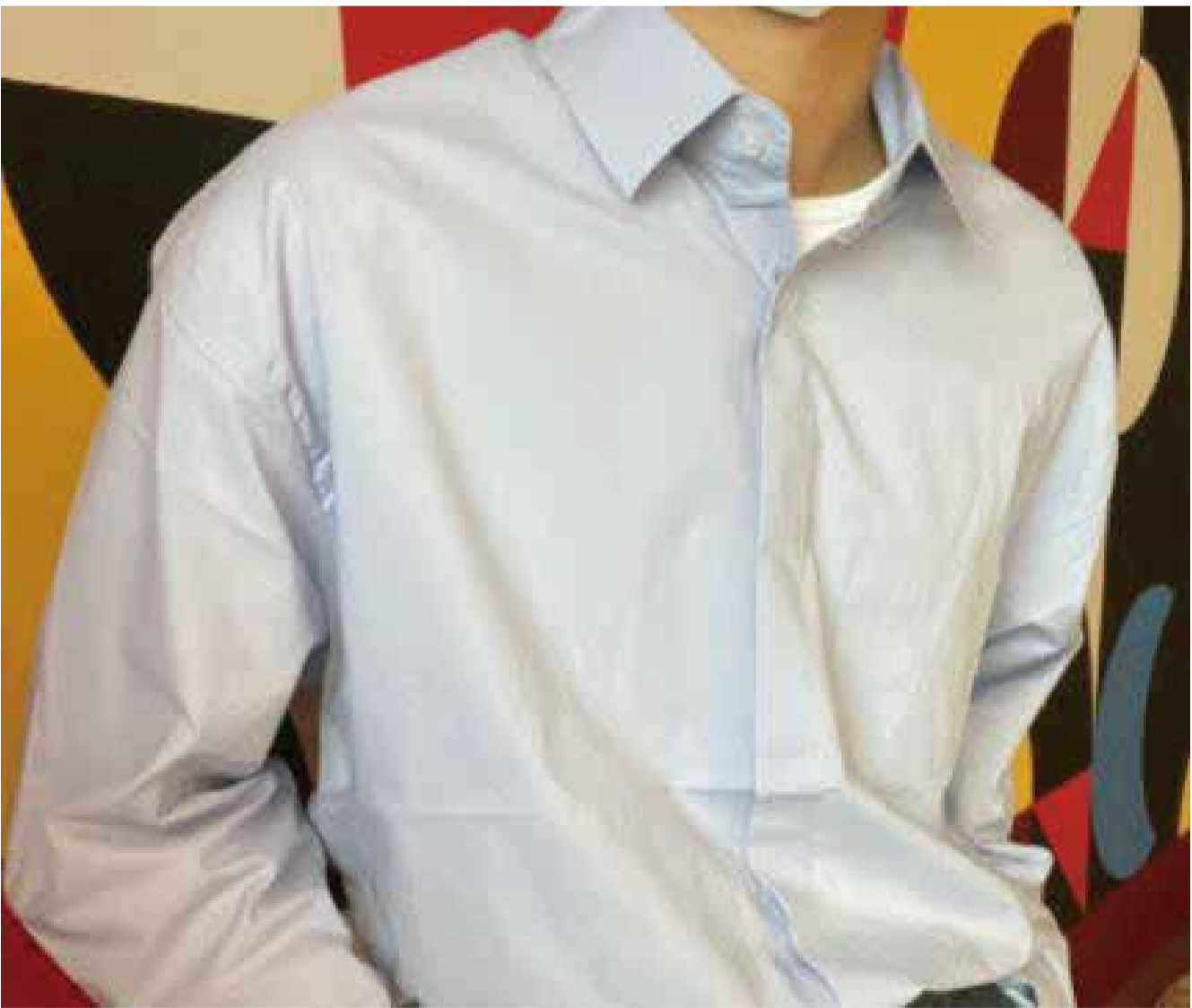
PPL 온라인 쇼핑몰 Law