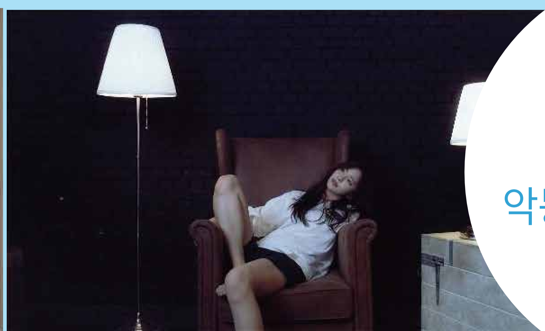
Xinso 악몽에서 깨어나는 법